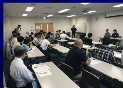
2019. 10. 5 研修会「外出の工夫」