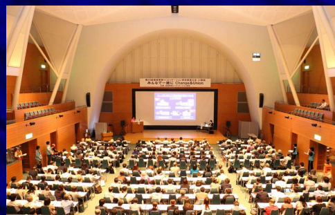
「視覚障害リハビリテーション研究発表大会in静岡」