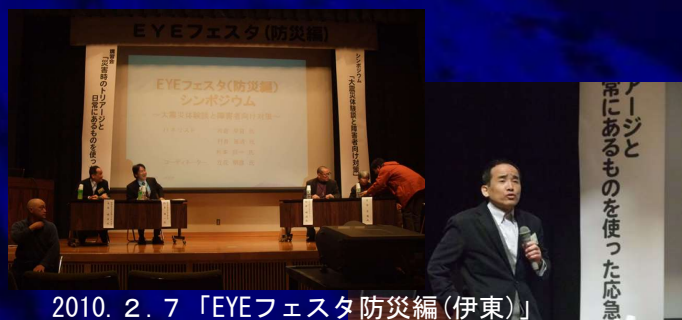
2010. 2. 7 「EYEフェスタ 防災編(伊東)」