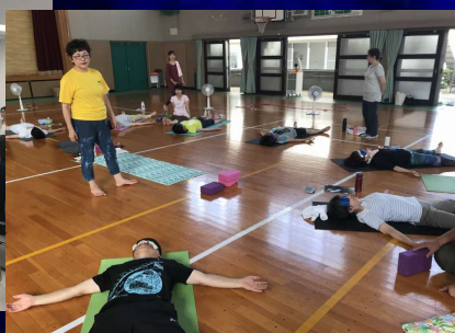
2018. 7. 21 研修会「ヨガ体験会」