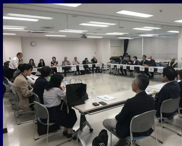
2018. 5. 11 総会