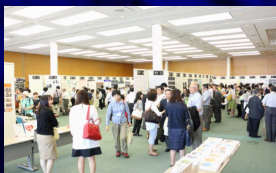
2016. 4. 16 開催協力